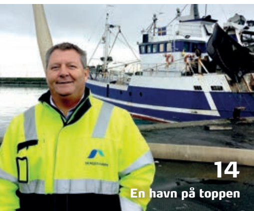
14 En havn på toppen