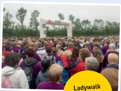
Ladywalk 29. maj 2017