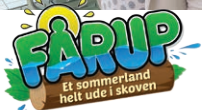
3F's familietræf i Fårup sommerland