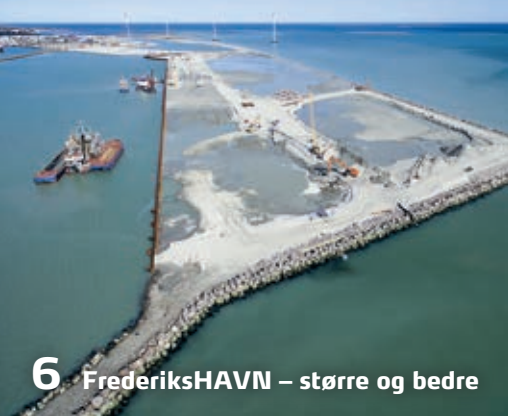
6 FrederiksHAVN – større og bedre