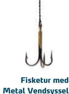
Fisketur med Metal Vendsyssel