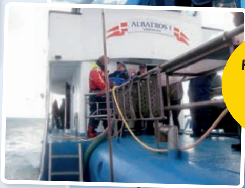
Havfisketur 29. april 2017