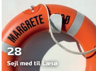
28 Sejl med til Læsø